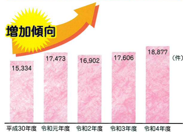
児童相談所における虐待相談対応件数の推移