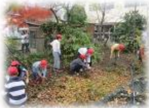
観察池が完成した (1982年)