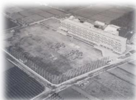
開校当時の宮前小 (1978年)