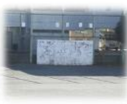
投的板が完成した (1984年)