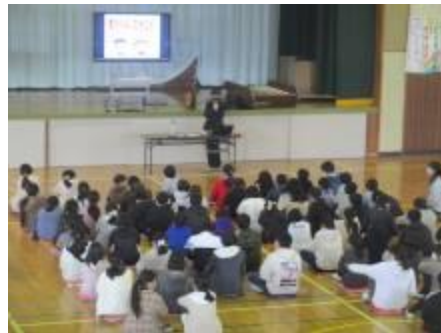
12/2 薬物乱用防止教室(6年)