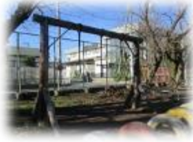
古電柱を利用した遊具が完成した(1986年)