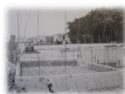
プールが完成した (1980年)