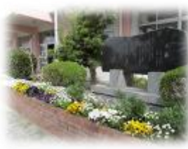
校歌碑ができた (1984年)