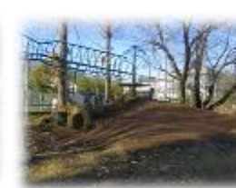
宮前山・郷土資料室完成(1987年)