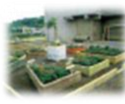
図形花壇ができた (1985年)