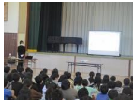
12/12 情報モラルの授業(高学年)